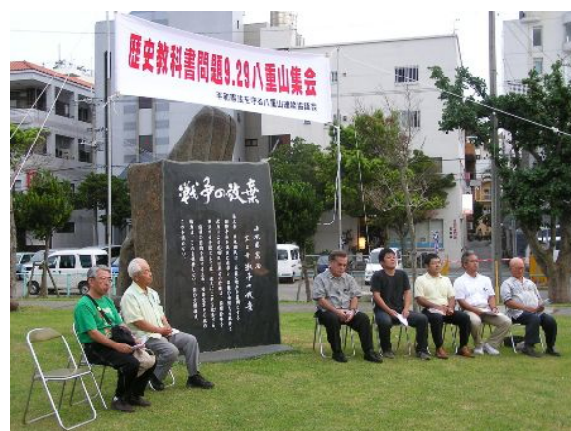
100名を超える方が集まりました

沖縄県民集会と連動し、八重山集会を開催できた事は大きな意義がある。子どもたちに真実を伝え、平和な社会を創るために声を上げていこう。