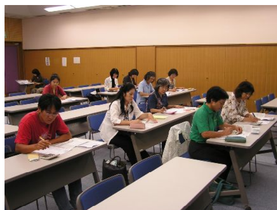
真剣な眼差しで計算していました。