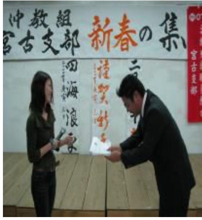
サプライズの新規加入