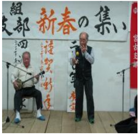
息のあった三線&けん玉演舞

*お陰様で1月21日現在、宮古支部の新規加入者は25名です。沖教組全体では150名です。これも各分会のみなさんが「組合の意義」等について親身に語ってくれているおかげです。Thank you so much!