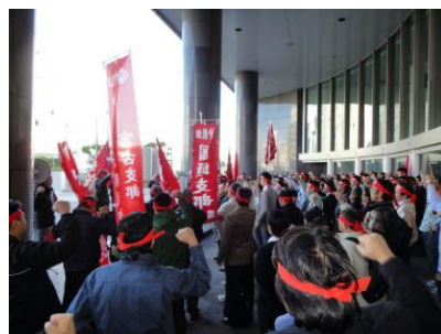
100名以上の組合員が参加し抗議集会を行いました！