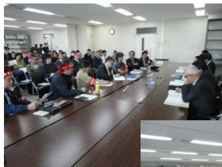
会場からの訴えが続く！

職場に混乱を起こさないように考えてほしいということで、この日の交渉は終わりました。どのような提案がされるのか注視していきましょう。