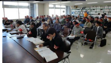
何を言っても理解してもらえず！